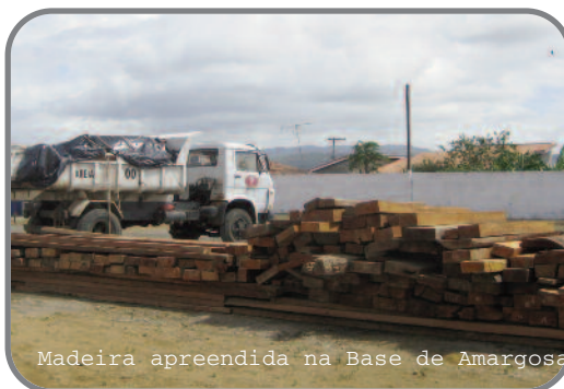
Madeira apreendida na Base de Amargosa

Qual o projeto que o MP está executando com recursos do Projeto CE? Quanto é o recurso?